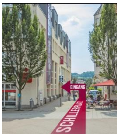
Eingang / Parken